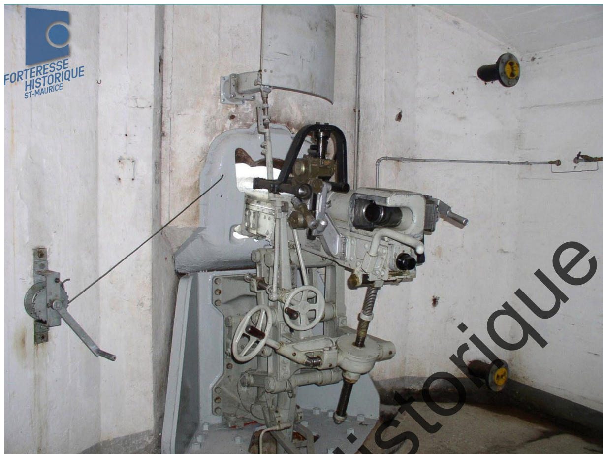
Fort Scex: Canon 7,5 cm 1903, batterie "Ermitage"