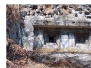
Fort du Scex